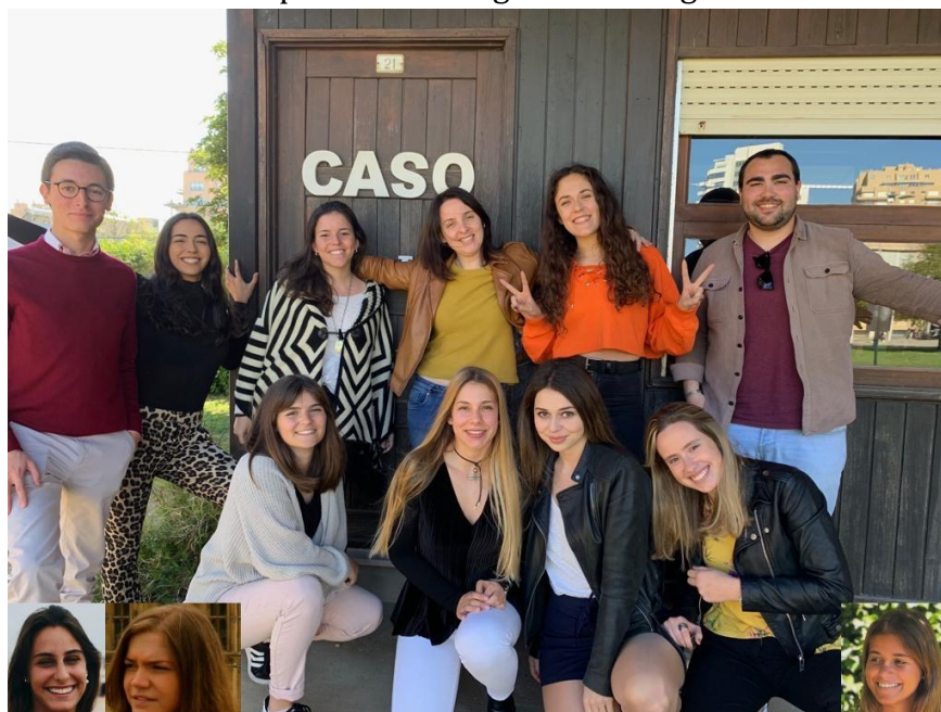
Equipa de responsáveis 18_19

Núcleo de voluntariado da Católica. Porto que dá a possibilidade a todos os interessados de fazerem acções de voluntariado pontuais ou regulares ao longo do ano.