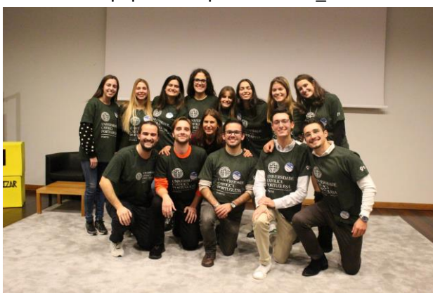
Equipa de responsáveis 19_20

Núcleo de voluntariado da Católica. Porto que dá a possibilidade a todos os interessados de fazerem acções de voluntariado pontuais ou regulares ao longo do ano ou no verão em Portugal ou no estrangeiro.